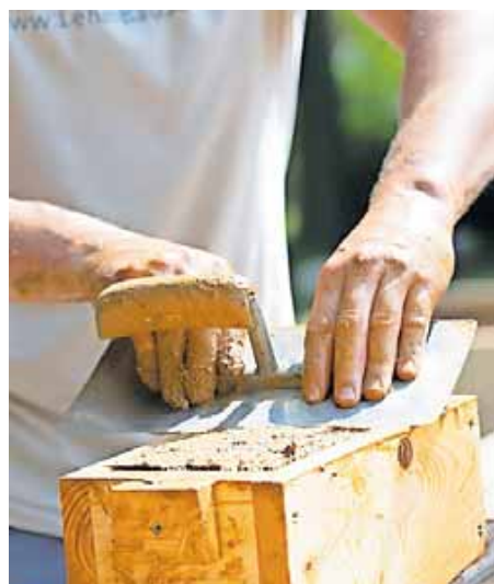
Das Auftragspolster beim Handwerk wird dünner, die Stimmung ist trotzdem nicht schlecht.

München – Das bayerische Handwerk macht trotz Wirtschaftsflaute noch gute Geschäfte, aber die Auftragspolster werden dünner. Der Bayerische Handwerksrat (BHT) rechnet preisbereinigt mit einem Umsatzrückgang von zwei Prozent für das Gesamtjahr.